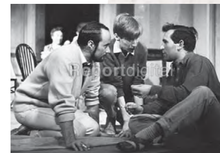
Ο Wesker με τον σκηνοθέτη John Dexter στις πρόβες για την πρώτη παράσταση στο Royal Court Theatre το 1959.