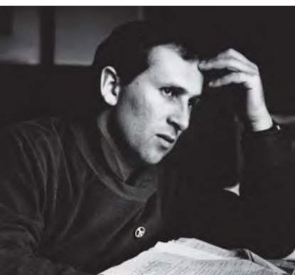
Ο συγγραφέας την εποχή που έγραφε την «Κουζίνα».

Παιδί, «μητρός μαγειρίσσας», «πατρός ράφτη», Εβραϊκής προσφυγικής οικογένειας ενεργών κομμουνιστών, γεννήθηκε στη λαϊκή συνοικία Stepney στο Ανατολικό Λονδίνο. Δεν πέρασε στο «Γυμνάσιο» και αργότερα, παρ' όλο που έγινε δεκτός στην R.A.D.A. (την σπουδαιότερη Δραματική Σχολή της Αγγλίας) δεν μπόρεσε να την παρακολουθήσει, επειδή δεν είχε τα χρήματα για τα δίδακτρα. Δούλεψε ως ζαχαροπλάστης, μάγειρας, βοηθός επιπλοποιός, πλασιέ βιβλίων, βοηθός υδραυλικός, αγροτικός εργάτης κ.ά.