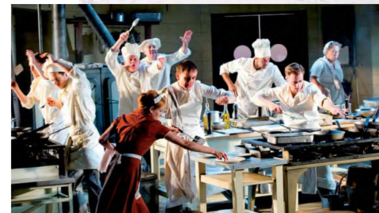
Από την αναβίωση του έργου στο Εθνικό Θέατρο της Αγγλίας το 2011.

«Η ΚΟΥΖΙΝΑ» ΣΤΗΝ ΙΣΤΟΡΙΑ ΤΟΥ ΣΥΓΧΡΟΝΟΥ ΘΕΑΤΡΟΥ