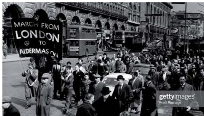
«... η Πορεία είχε κλείσει το δρόμο και τα λεωφορεία δεν μπορούσαν να κυκλοφορήσουν κανονικά ...».

Στα μέσα της δεκαετίας του '50, που έγραψε την «ΚΟΥΖΙΝΑ», εκπνιάχτηκε στη φήμη, ως ένας από το κύμα των νέων Άγγλων θεατρικών συγγραφέων, που μαζί με τον John Osborne και τον John Arden στην πρωτοπορία, ονομάστηκαν "Angry Young Men", (από το έργο του Osborne "Look back in Anger") και έφεραν επανάσταση στο κατεστημένο του επίσημου Αγγλικού θεάτρου, με τα έργα τους που παίζονταν στο «περιθωριακό» Royal Court Theatre, στο Chelsea του Λονδίνου. Ο Laurence Olivier, ο οποίος, με απίστευτο θάρρος, έπαιξε τον πρωταγωνιστή στο έργο "The Entertainer" του Osborne, έχει πει, με υπερβολική (νομίζω) ταπεινοφροσύνη, ότι χάρη σ' αυτά τα παιδιά και αυτό το θεατρικό βγήκε από τον «χρυσελεφάντινο πύργο» του κατεστημένου θεάτρου.